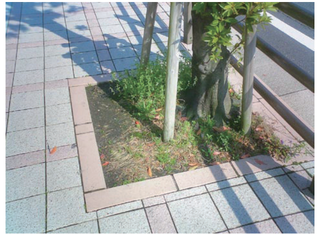
↑ 縁石をフラットにしても、雑草の問題が・・・