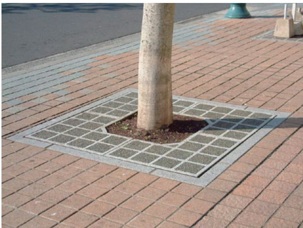
↑ 透水性のKCサークルを使用すると・・・ 雑草は樹木周りのみ。集水穴もなく、よりバリアフリーに・・・