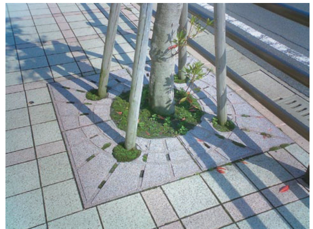
↑ KCサークルの採用により、雑草の問題もほぼ解決