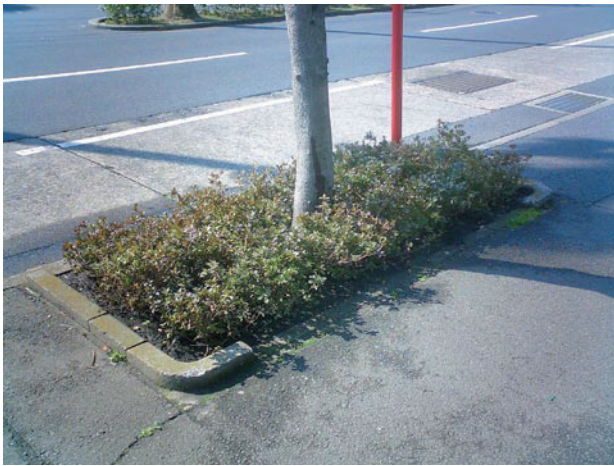
↑ 飛び出した縁石に歩行者がつかず危険性 植栽部の土が歩道に流れ出し汚れる・・・