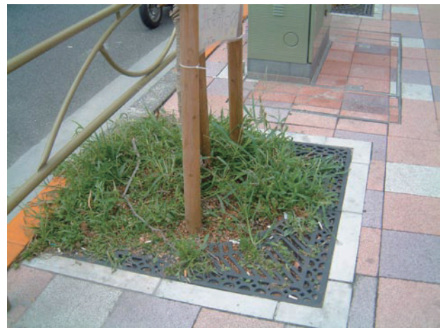
↑ 鋳物のサークルを施工しても 開口部分が多いため、雑草がはみ出し、ゴミも溜まりやすい。